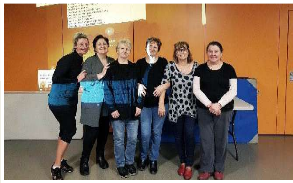
Centre Social Espace Jeunesse et Familles, Eaubonne (95)